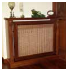
2. το κάλυμμα (καλοριφέρ)