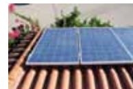
6. τα φωτοβολταϊκά