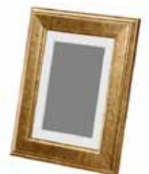
6. η κορνίζα