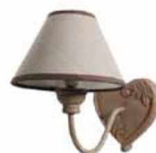
5. η απήλικα