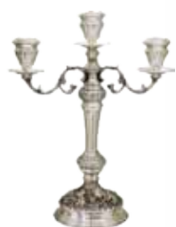
1. το κηροπήγιο