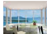
3. η τζαμαρία