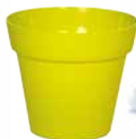
3. το κασπό