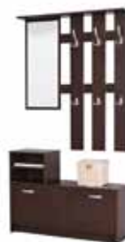
4. το πορτμαντό