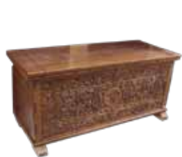
1. η κασέλα