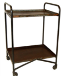
6. το τρόλεϊ (τραπεζάκι)