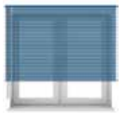
4. οι περσίδες