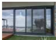
5. τα κουφώματα (από αλουμίνιο)