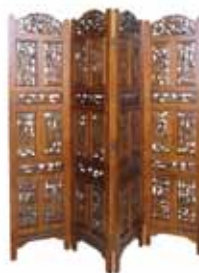
3. το παραβάν