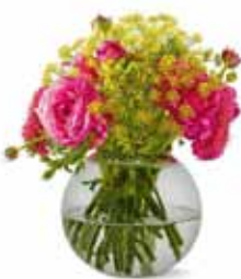
2. το ανθοδοχείο