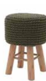
5. το σκαμπό