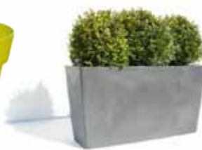
4. η ζαρντιέρα