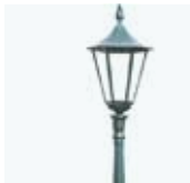
1. ο φανοστάτης